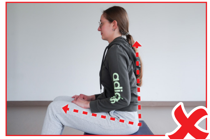
Sitzposition - Falsch