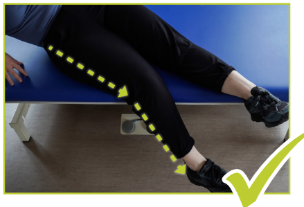
Aufstehen: über die betroffene Seite