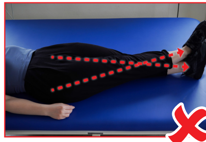
Die Beine nicht überkreuzen

Gerne steht Ihnen das Team der Physiotherapie bei Nachfragen zur Verfügung.