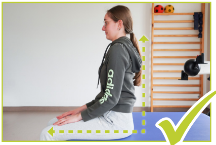
Aufrechte Sitzposition - Richtig